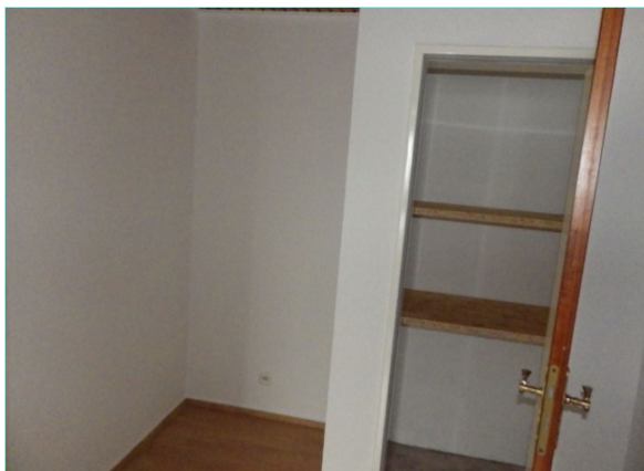
Diele und Abstellkammer