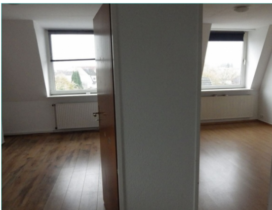
Wohnzimmer und Schlafzimmer